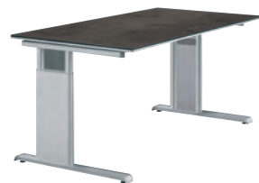
C-Fußgestell - alufarbig C frame - aluminium coloured