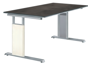
C-Fußgestell - weiß/alufarbig C frame - white/aluminium coloured