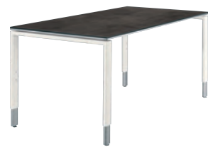
4-Fußgestell - weiß/alufarbig 4-legged frame - white/aluminium coloured