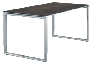
Kufen-Fußgestell - alufarbig Runner frame - aluminium coloured