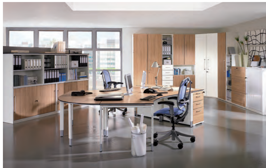
objekt.plus in Ausführung 9010: Korpus Weiß, Front/Schreibtischplatte Kernbuche Nachbildung objekt.plus in finish 9010: White body, front/ desktop in core beech heartwood effect