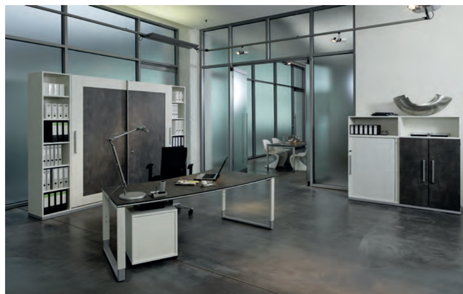
objekt.plus in Ausführung 9060 Korpus Weiß, Front/Schreibtischplatte Quarzit objekt.plus in finish 9060: white body, front/ desktop in Quarzit