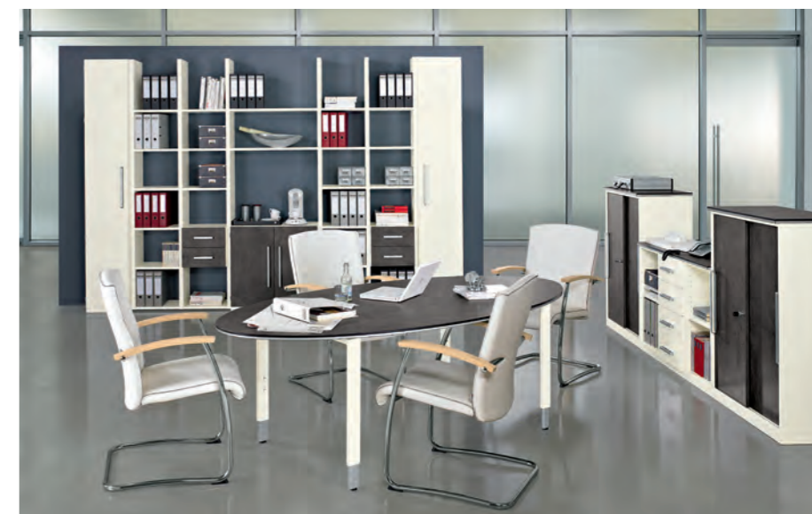
objekt.plus in Ausführungskombination 9060/9000 – Fronten Weiß mit Quarzit gemischt objekt.plus in combination 9060/9000: white fronts mixed with Quarzit