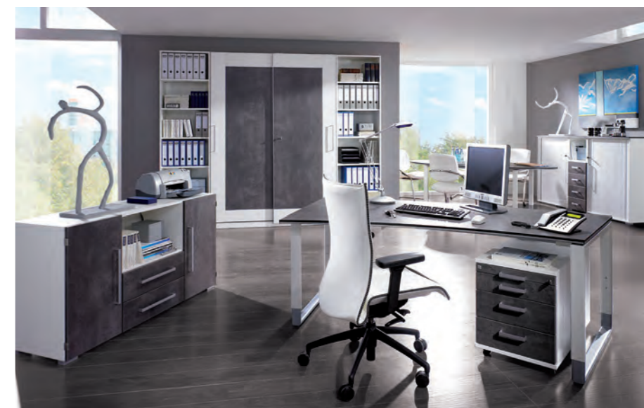
objekt.plus in Ausführung 9060 Korpus Weiß, Front/Schreibtischplatte Quarzit objekt.plus in finish 9060: white body, front/ desktop in Quarzit