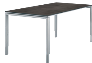
4-Fußgestell - alufarbig 4-legged frame - aluminium coloured