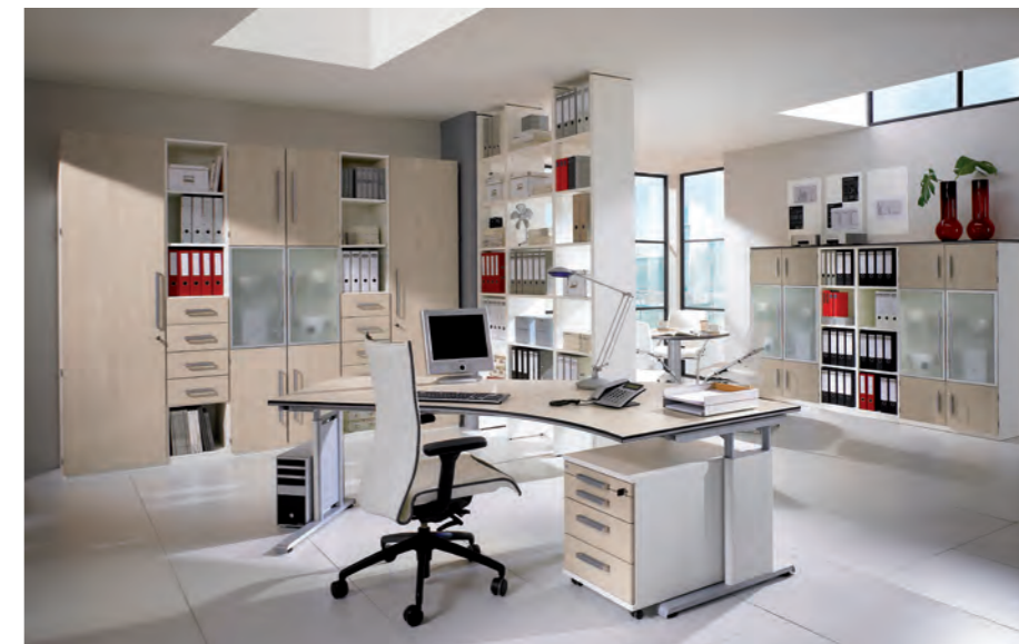
objekt.plus in Ausführung 9010: Korpus Weiß, Front/Schreibtischplatte Kernbuche Nachbildung objekt.plus in finish 9010: White body, front/ desktop in core beech heartwood effect