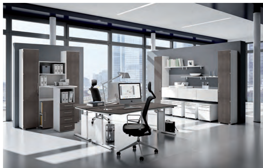
objekt.plus in Ausführungskombination 9060/9000 – Fronten Weiß mit Quarzit gemischt objekt.plus in combination 9060/9000: white fronts mixed with Quarzit