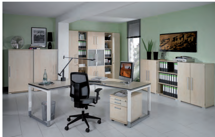
objekt.plus in Ausführung 7100: Korpus/Front/Schreibtischplatte Ahorn Nachbildung objekt.plus in finish 7100: body/ front/ desktop in maple effect