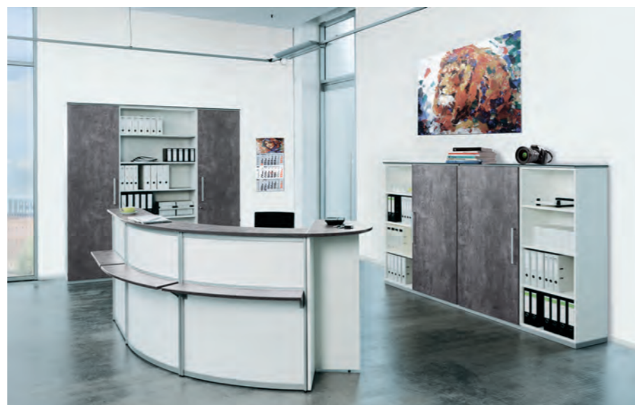
objekt.plus in Ausführung 9060 Korpus Weiß, Front/Schreibtischplatte Quarzit objekt.plus in finish 9060: white body, front/ desktop in Quarzit