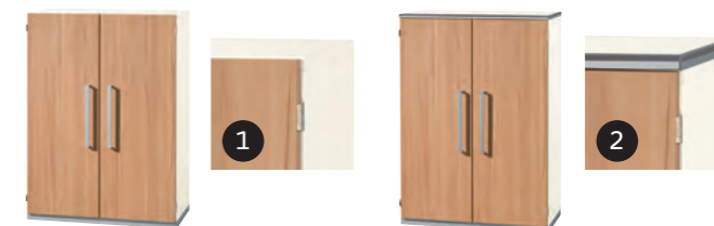
Korpus ohne Abdeckplatte Body without cover plate

The body system follows the principle of offering the customer the maximum level of services. All body parts can be fitted with or without a cover plate. All items are shipped fully assembled.