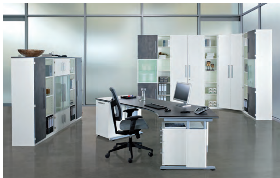
objekt.plus in Ausführungskombination 9060/9000 – Fronten Weiß mit Quarzit gemischt objekt.plus in combination 9060/9000: white fronts mixed with Quarzit